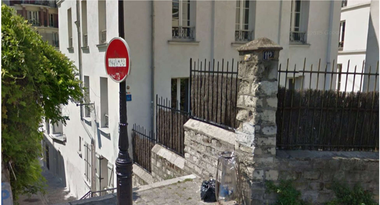
Rue Lepic, Paris