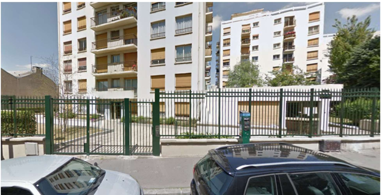
Rue de la Duée, Paris